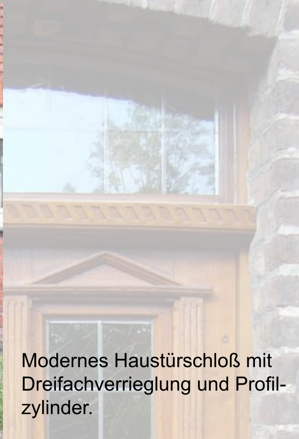
Modernes Haustürschloß mit Dreifachverriegelung und Profilzylinder.