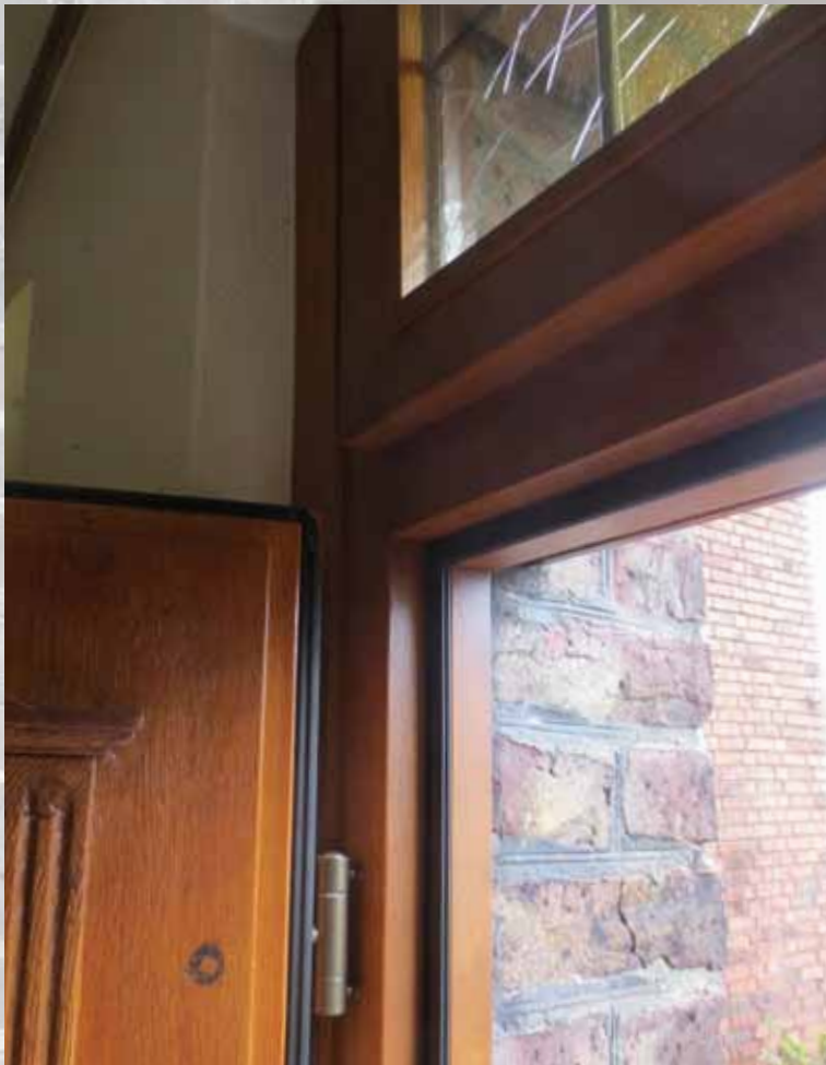
Der neu erstellte Blendrahmen mit Oberlicht und Isolierverglasung.