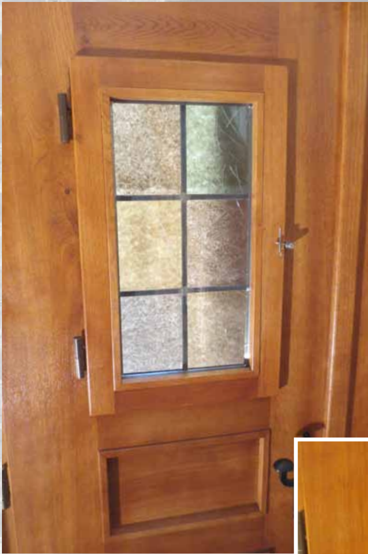
Details der Innenansicht.