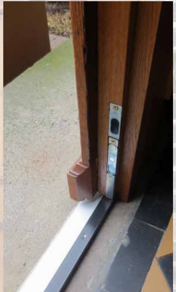
Der neu eingearbeitete Sicherheitsschließblech.